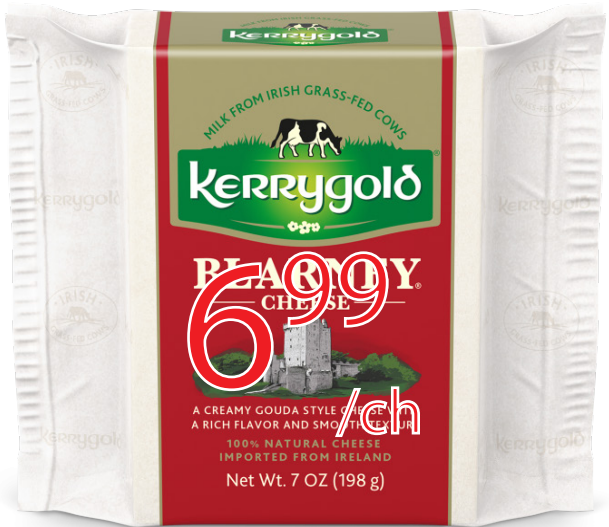
Cheddar Kerrygold Blarney 198g