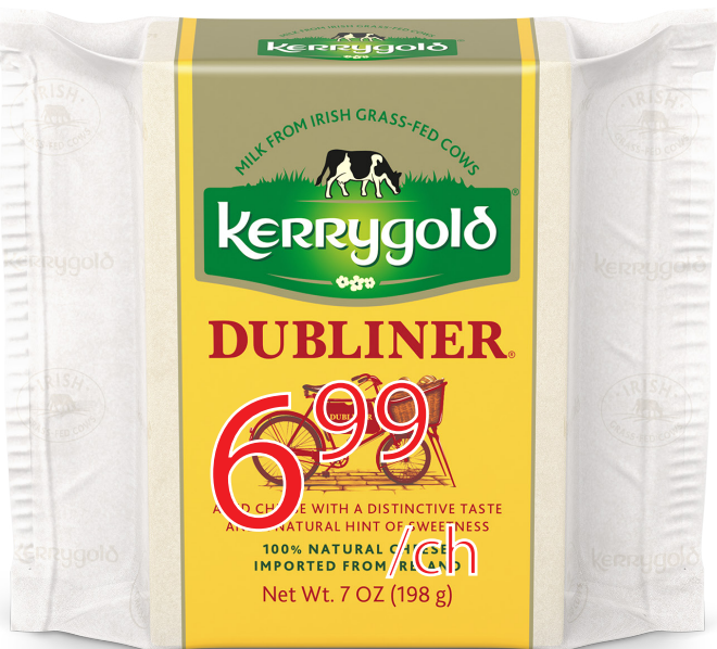
Cheddar Kerrygold Dubliner 198g