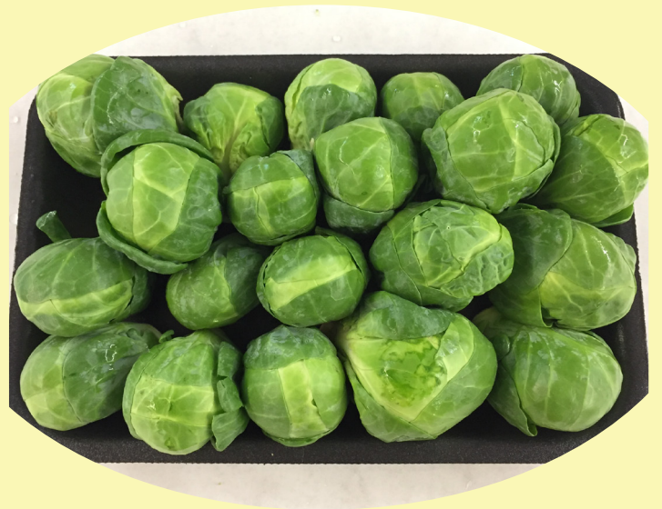
Chou bruxelle Mexique 8.80$/kg