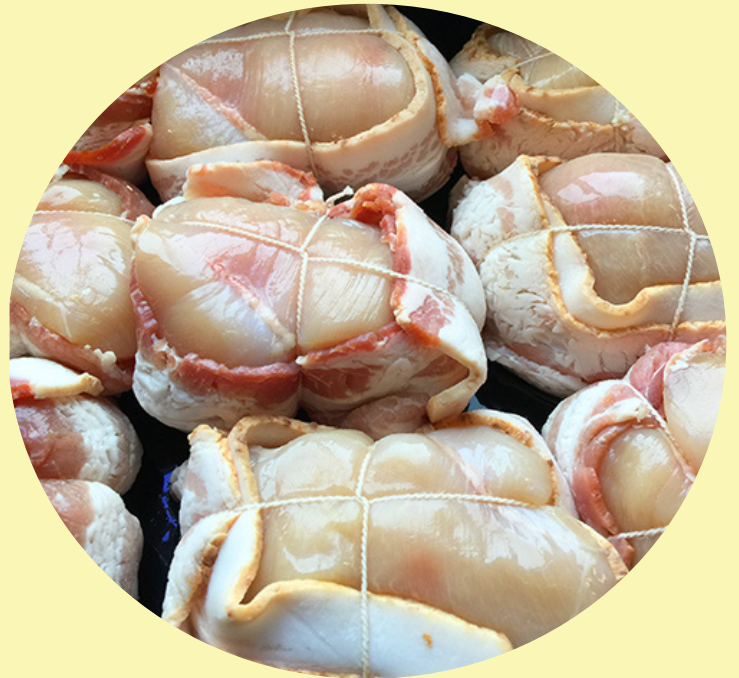
Tournedos poulet familial 19.81$/kg