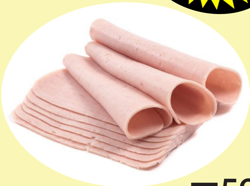
Pain poulet Fortin 16.74$/kg