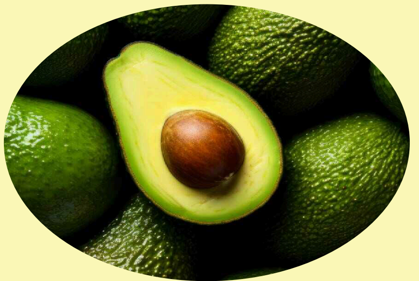
Avocat Gr.16-20 Mexique