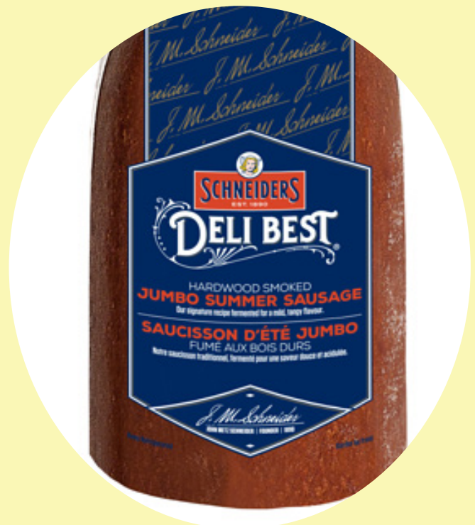
Saucisson d'été jumbo 44.07$/kg