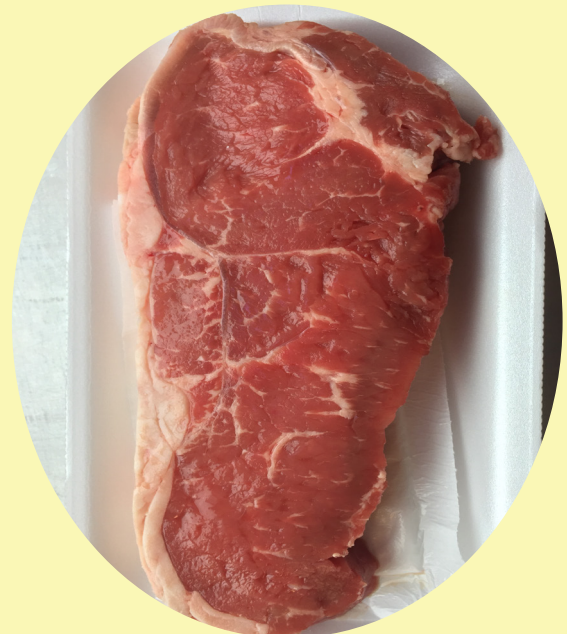
Bifteck contre filet A ou AA 45$/kg