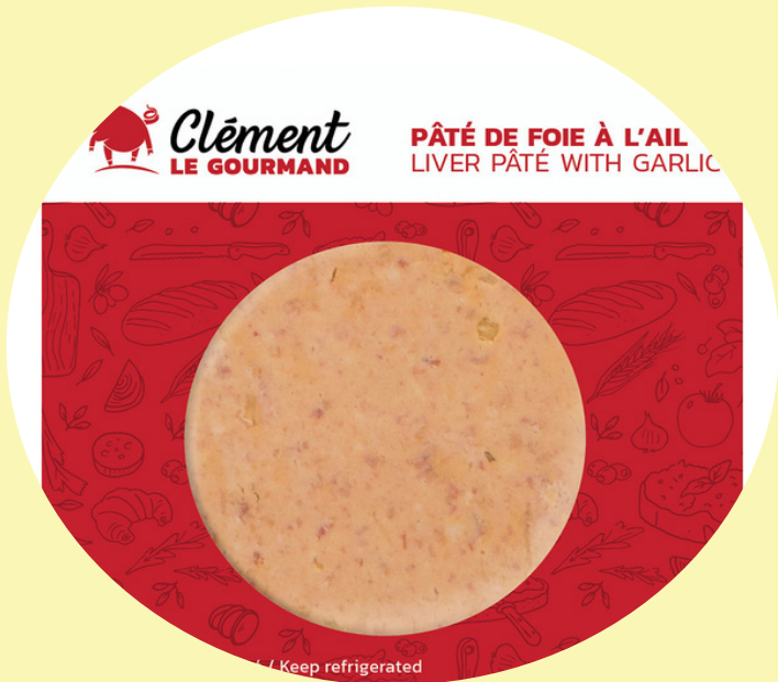
Clément le Gourmant Paté foie et paté campagne Différentes saveurs 150g