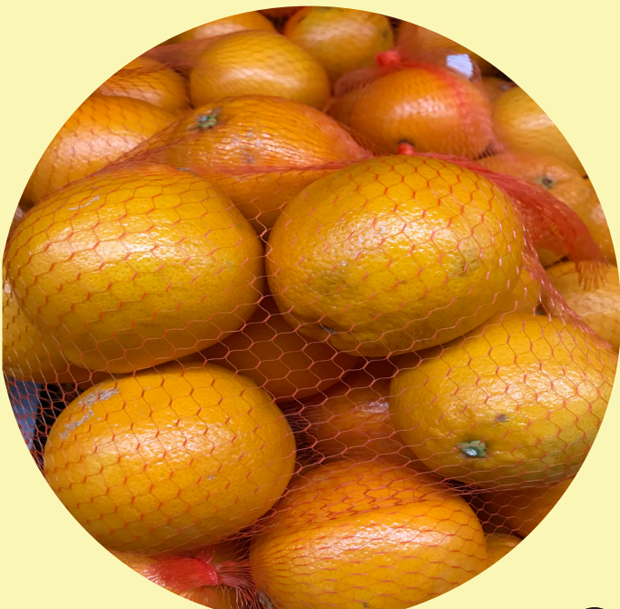
Orange Gr.72 filet de 6 Califronie