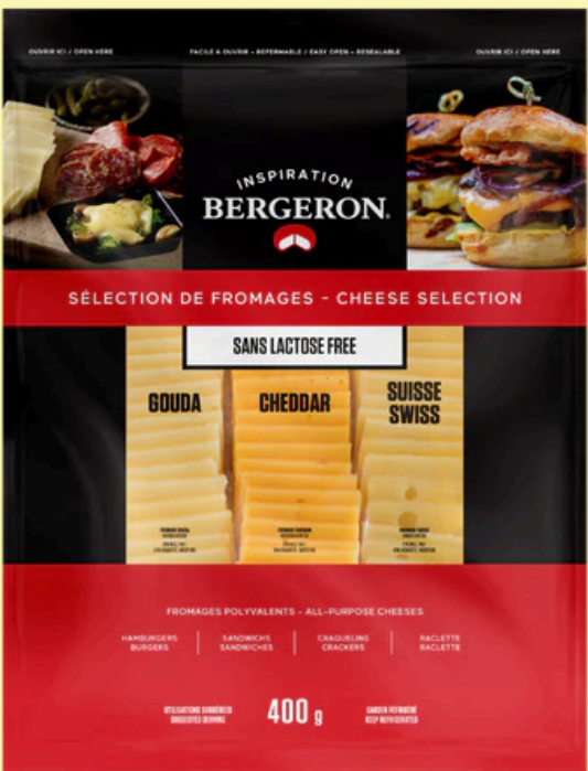
Bergeron Inspiration sans lactose 400g