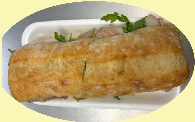
Sous-marin baguette de luxe 300g