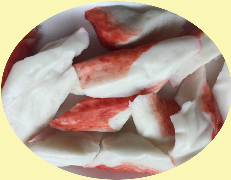
Crabe goberge 17.61$/kg