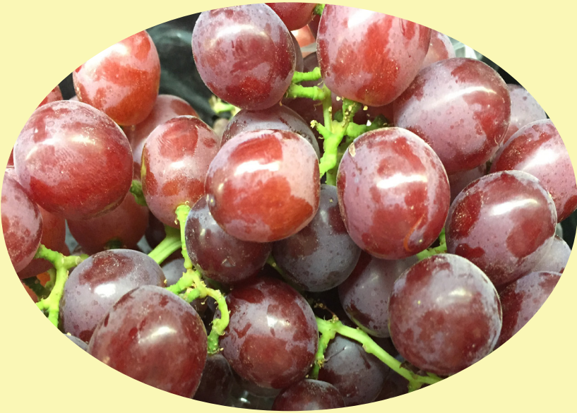
Raisins rouge Pérou ou Afrique du Sud 6.59$/kg