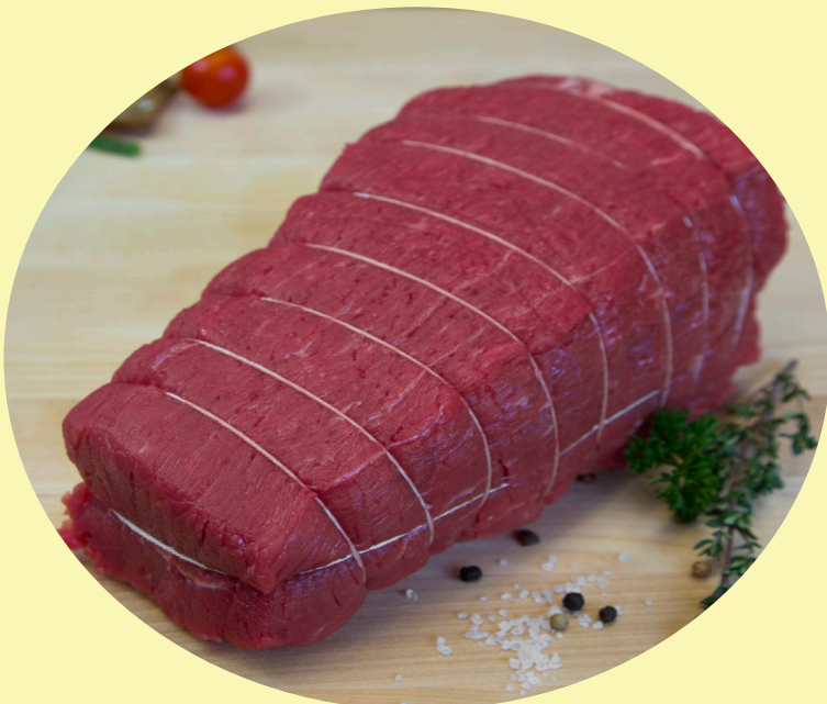
Rosbif français de boeuf 25.99$/kg