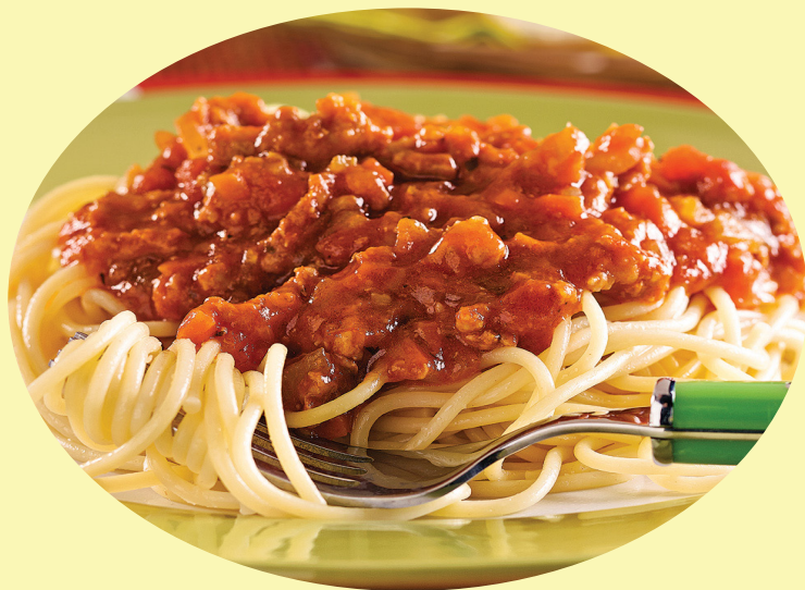
Spaghetti gratiné sauce a la viande 22.02$/kg