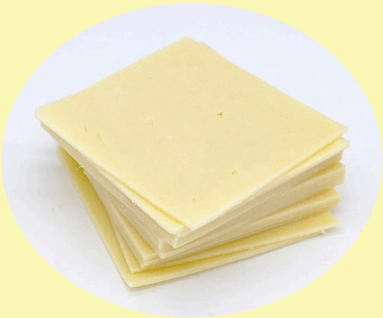
Mozzarella tranché 35.26$/kg