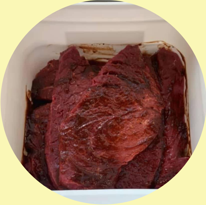
Bifteck français chaudière de 10 lb Marinade au choix