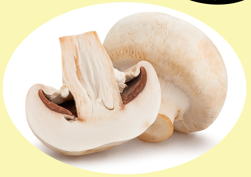
Champignon 227g Ontario