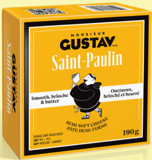
Monsieur Gustav Saint-Paulin 190g