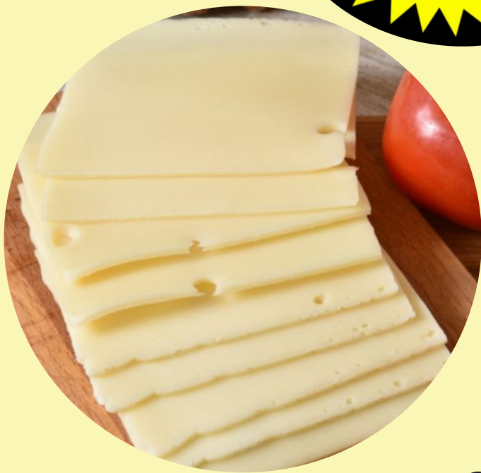
Suisse tranché 35.26$/kg