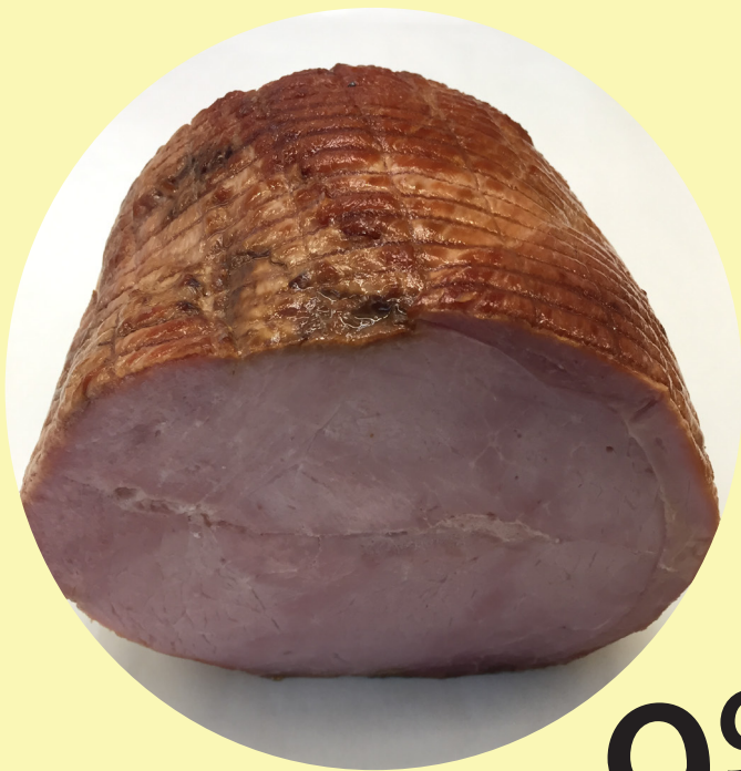
Jambon a l'ancienne fumé extra-maigre 22.02$/kg