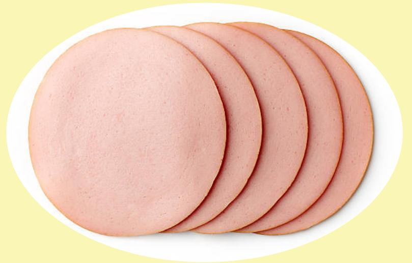
Bologne saucisson régulier (Lester) 13.21$/kg