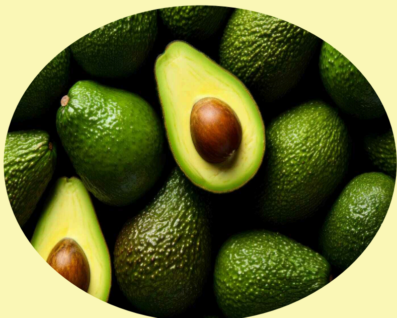
Avocat Gr.16/20 Importé