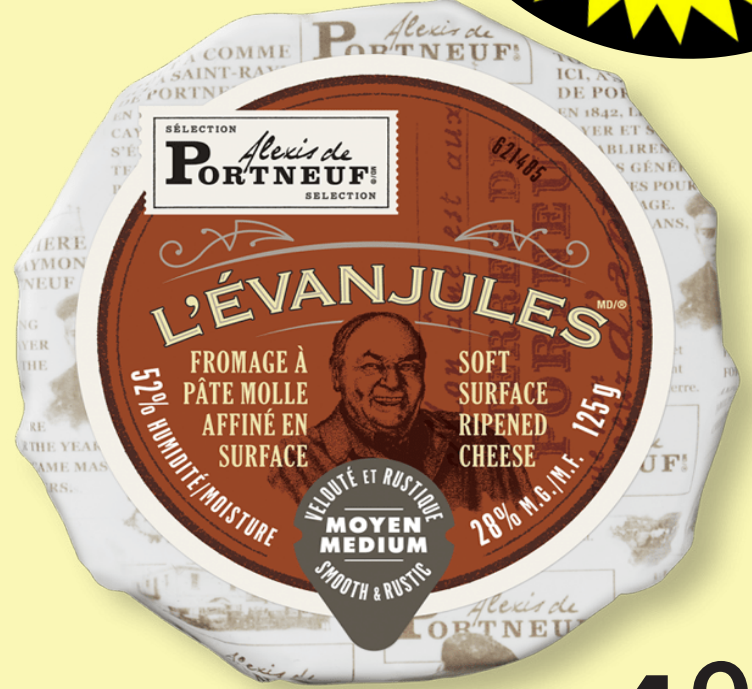
L'évanjules Alexis de Portneuf