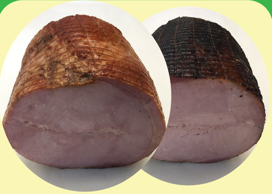
Jambon a l'ancienne fumé extra-maigre ou jambon forêt noire 22.02$/kg