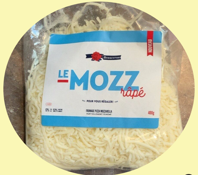
Le Mozz rapé 400g Beauceron