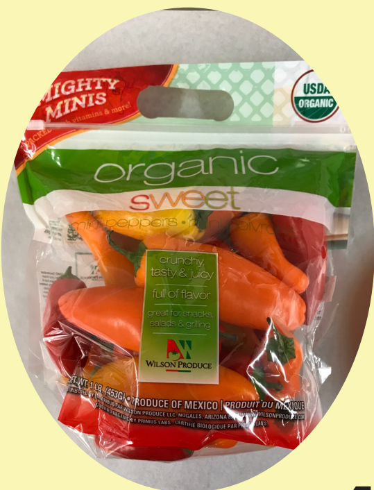
Piments doux mini 454g Mexique