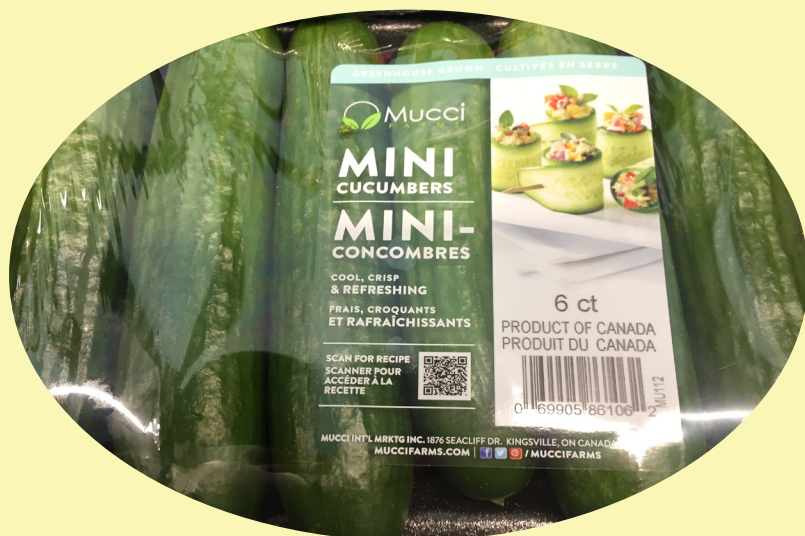
Concombre libanais Canada