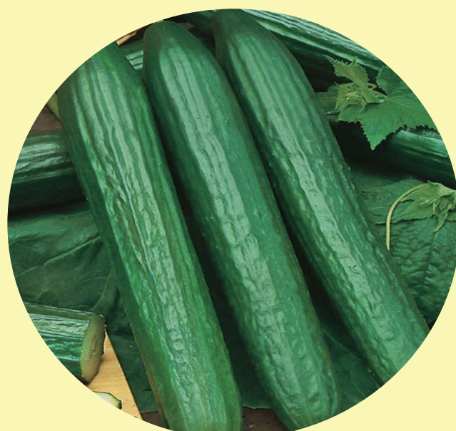
Concombre anglais Canada