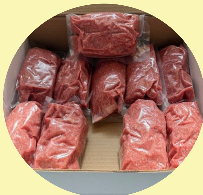
Boeuf haché mi-maigre congelé 10 x 1 lb