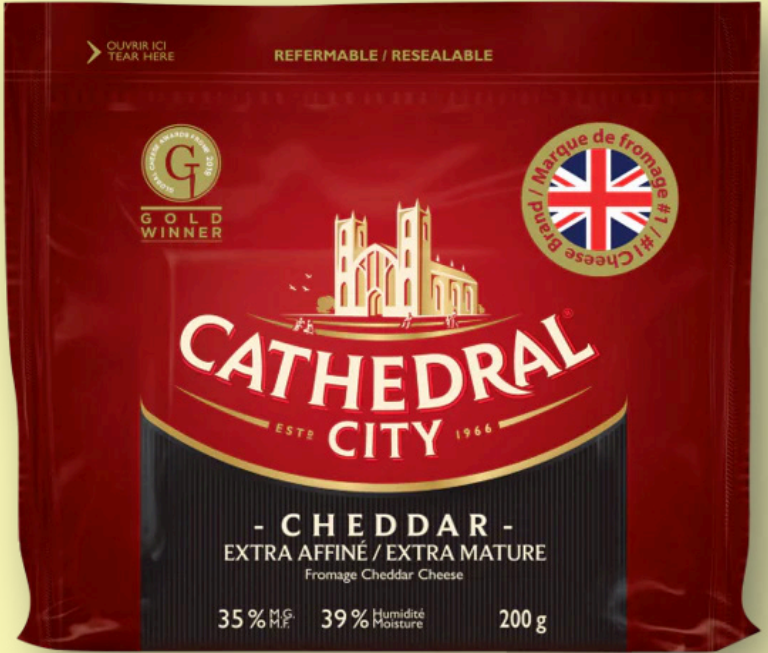
Fromage cheddar Cathedral City 200g