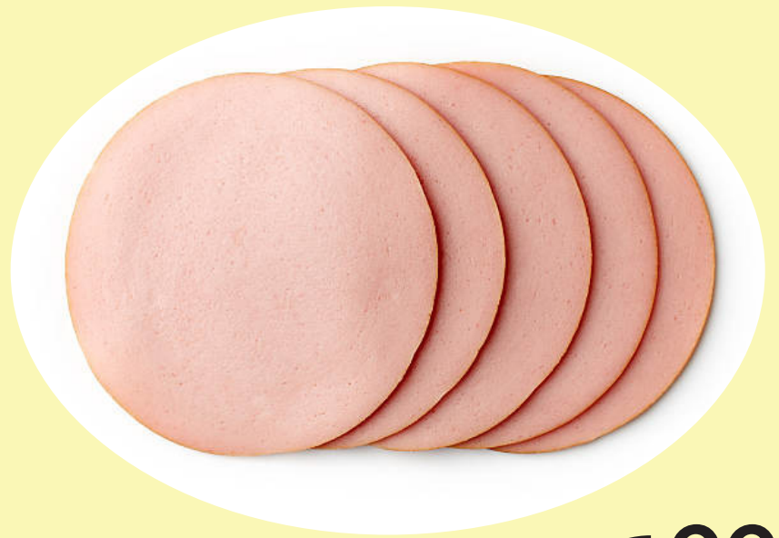
Bologne ciré Olymel 15.41$/kg