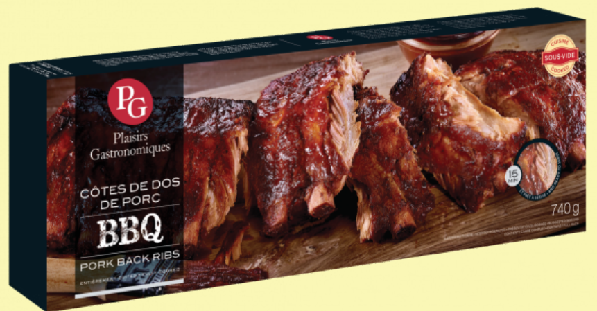
Cote lever Plaisir Gastronomique