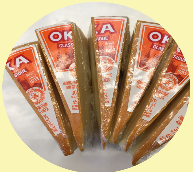
Oka classique 41.87$/kg