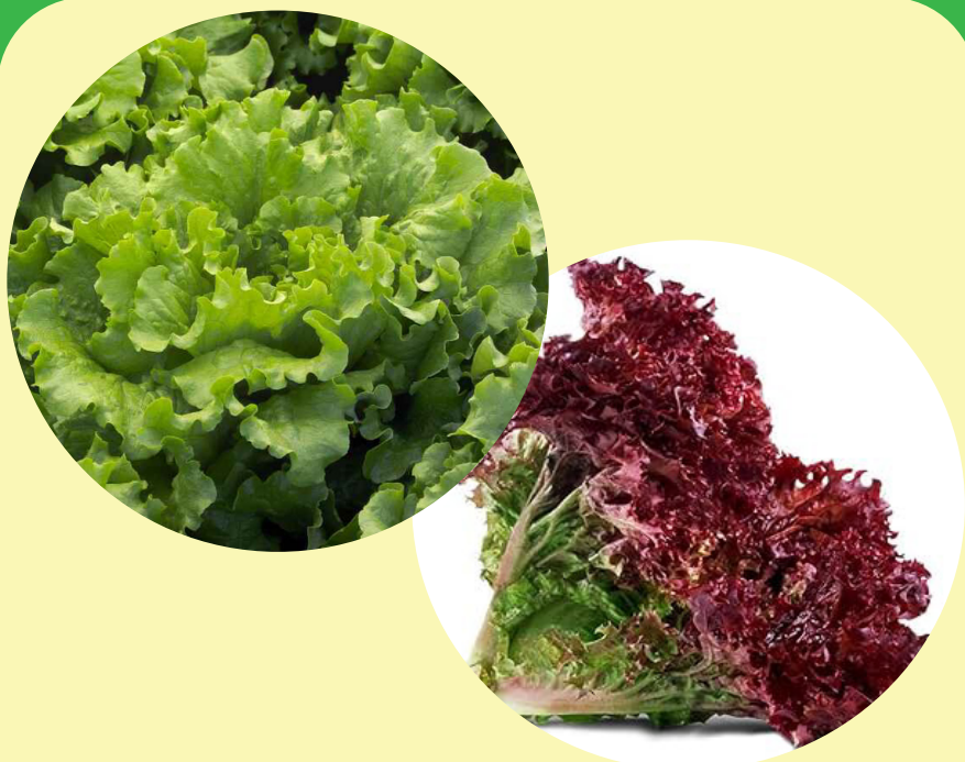
Laitue frisée verte ou rouge Québec