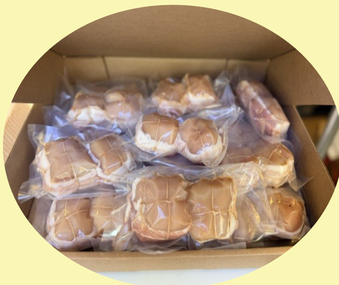
Tournedos de poulet 10 lb