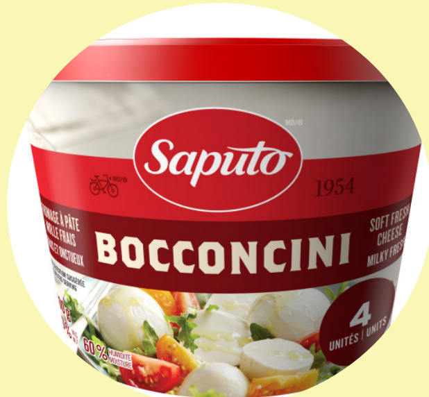
Bocconcini Saputo 200g