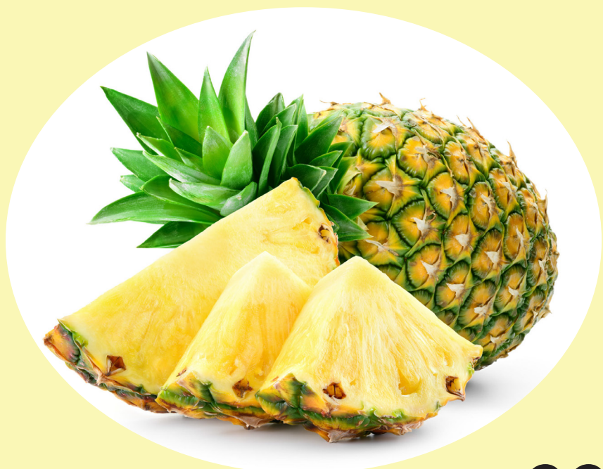
Ananas Gr.5 Costa Rica