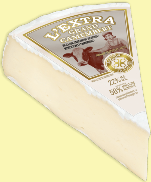
Grand camembert Agropur 41.87$/kg