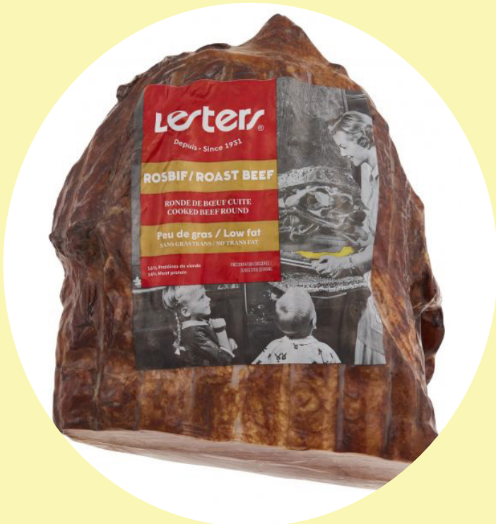
Roast beef cuit Lesters 44.07$/kg