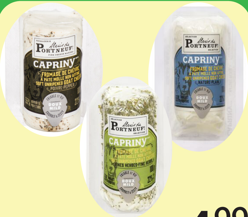
Capriny nature, fines herbes ou poivre (100g) Alexis de Portneuf