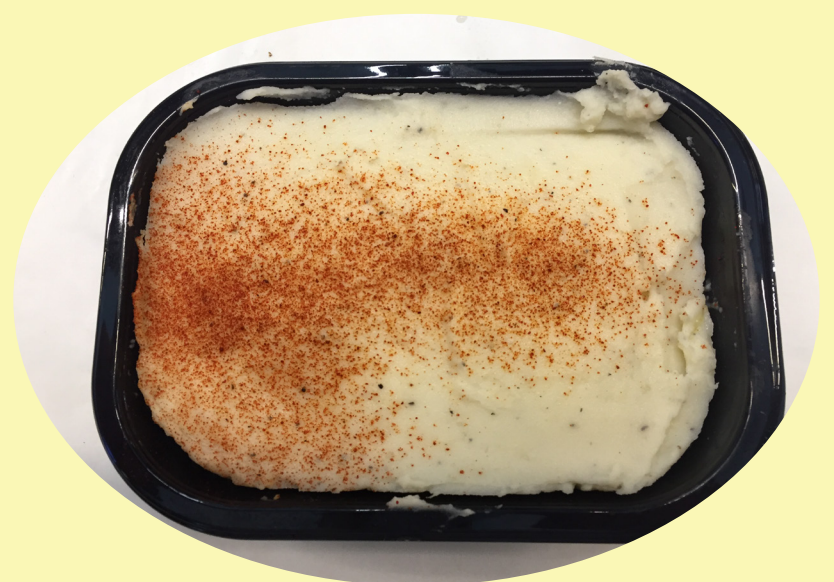
Paté chinois Maison Corne 19.82$/kg