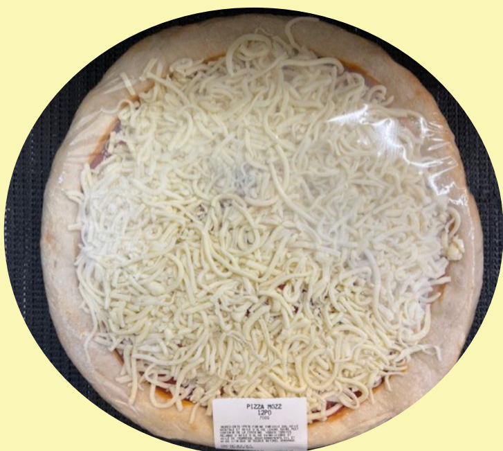
Pizza mozz 12 pouces 700g