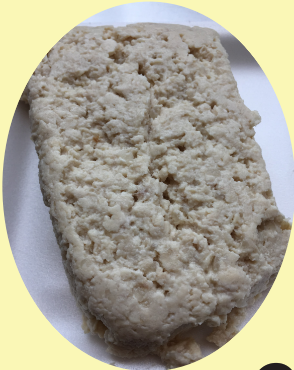
Creton porc 19.90$/kg