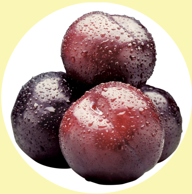
Prune noir black splendor Californie 8.80$/kg