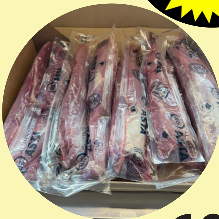
Filet mignon de porc 10 lb