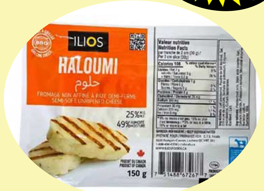
Haloumi Ilios Fromage a griller 150g