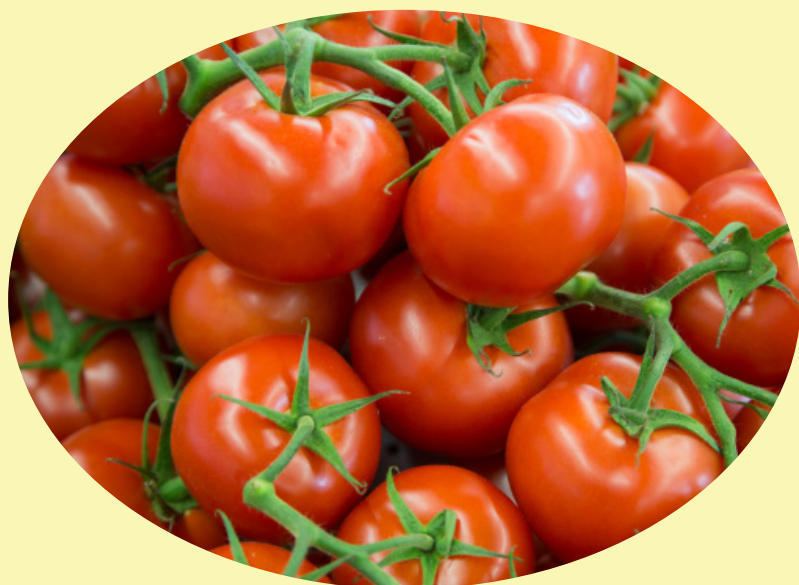
Tomate grappe Canada 4.39$/kg