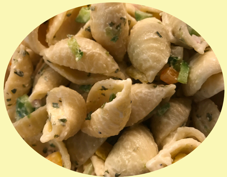
Salade coquille cremeuse 19.82$/kg