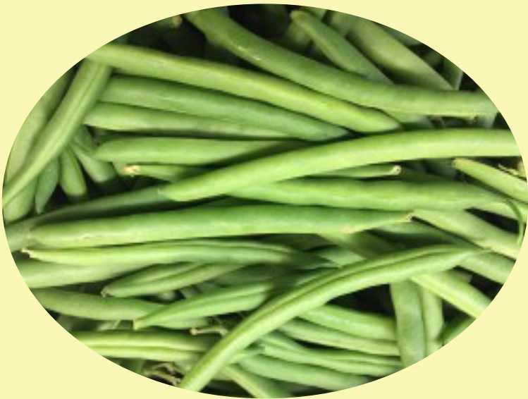
Fève verte États-Unis 8.80$/kg