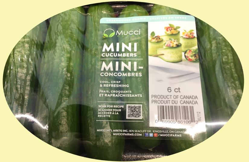
Concombre libanais Canada