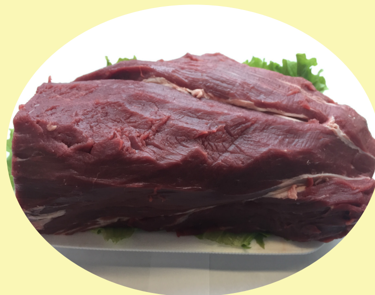
Filet mignon complet 59.99$/kg