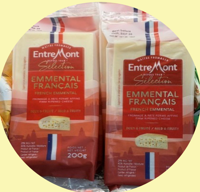
Emmental français EntreMont 200g