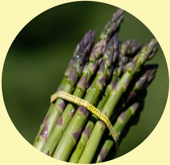
Asperge Îles d'Orléans 6.59$/kg