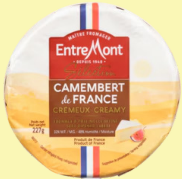
Brie camembert EntreMont 227g