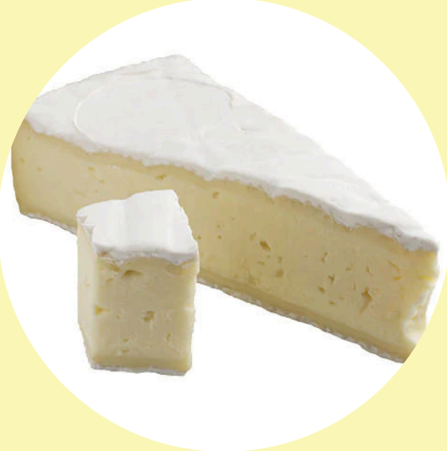
Brie l'Extra Agropur 37.46$/kg