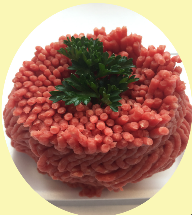
Boeuf haché mi-maigre 2.5 lb