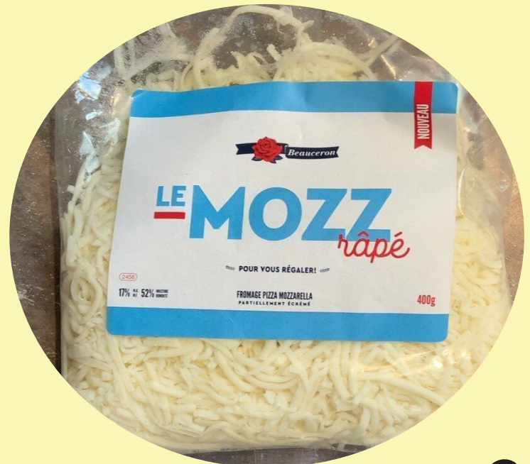
Le Mozz rapé 400g Beauceron