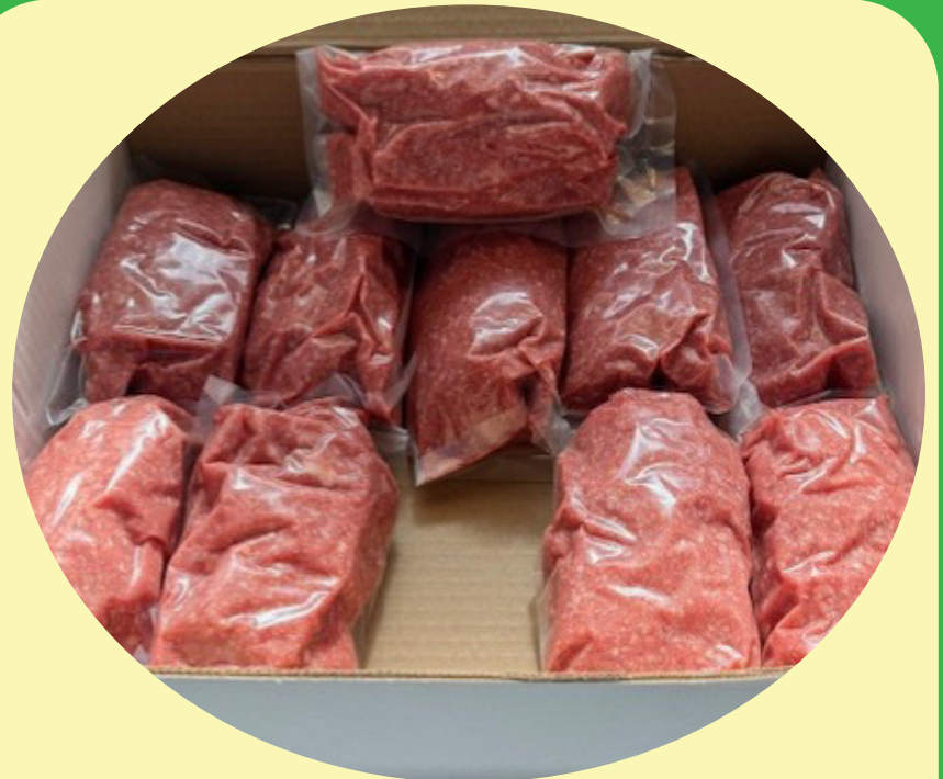
Boeuf haché mi-maigre congelé 10 x 1 lb