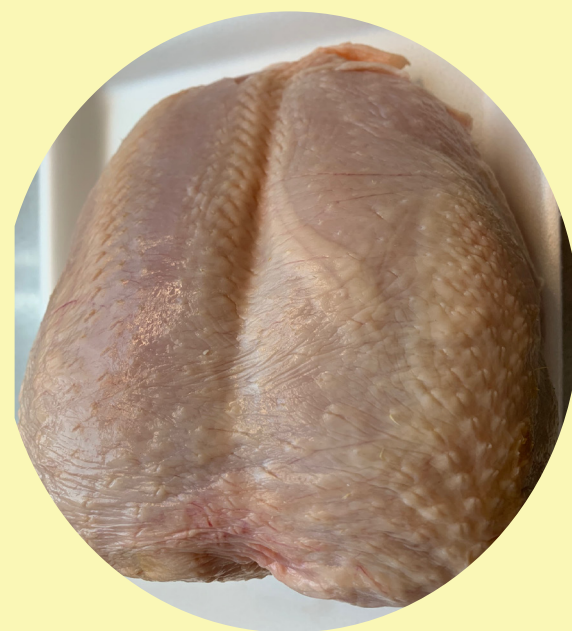
Poitrine de poulet refroidie a l'air avec os 11.99$/kg