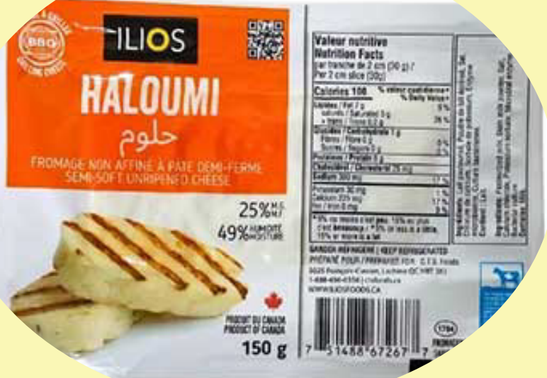
Haloumi Ilios Fromage a griller 150g