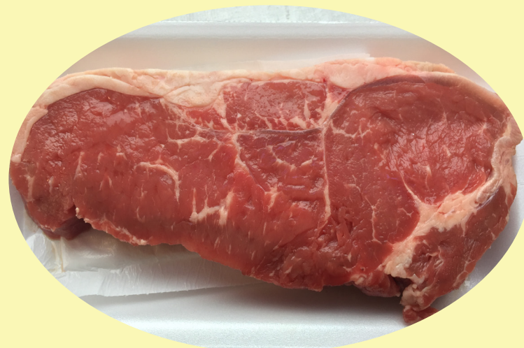
Bifteck contre filet A ou AA 53.99$/kg