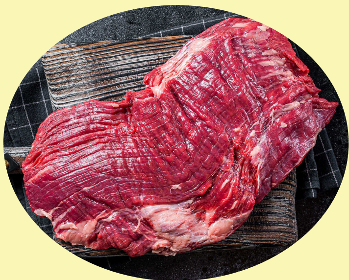
Bavette de boeuf AA 51$/kg