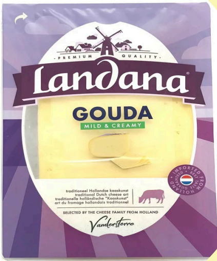
Fromage Landama 150g Gouda, emmental, olive et tomate, maasdam, edam