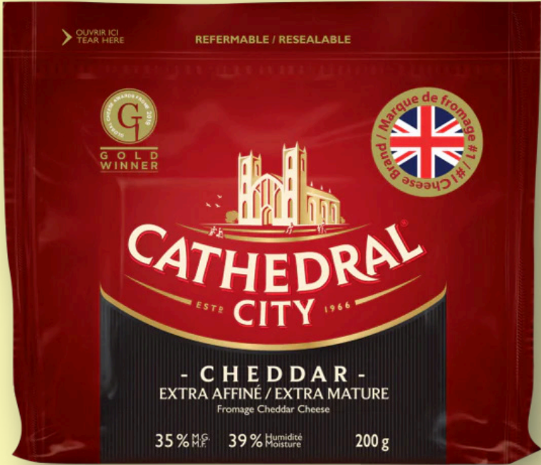
Fromage cheddar Cathedral City 200g