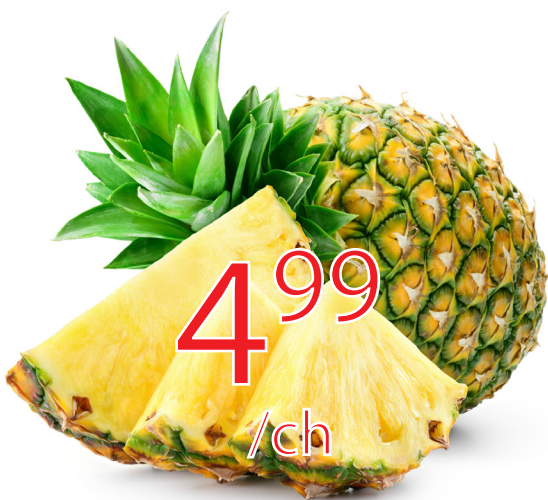
Ananas Gr.5-6 Costa Rica