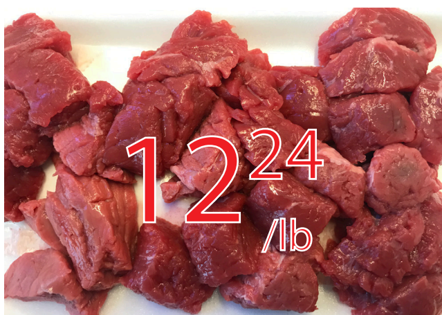
Cube de boeuf bourguignon 26.99$/kg