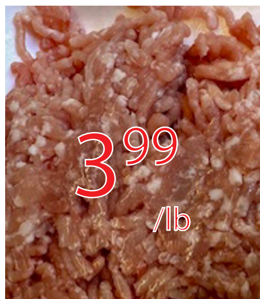
Porc haché frais maigre 8.80$/kg