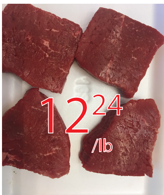
Tournedos boeuf familial Attendri mecaniquement 26.99$/kg