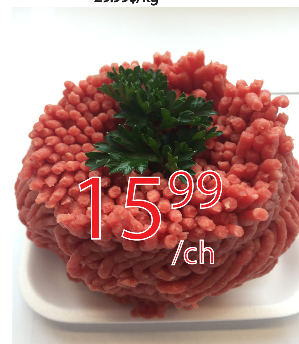
Boeuf haché mi-maigre 2.5 lb