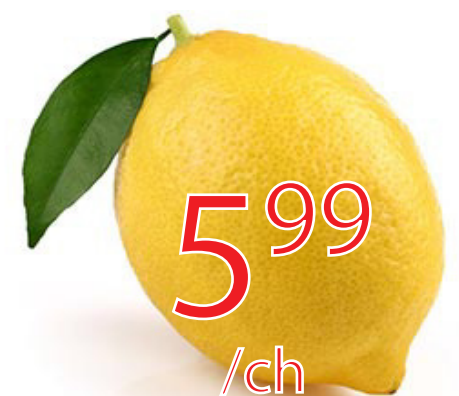
Citron (paquet de 6) Californie