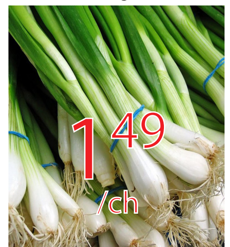
Échalote Gr.48 États-Unis