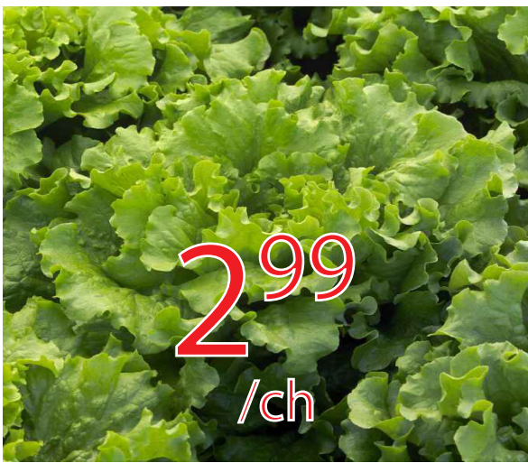
Laitue feuille verte Gr.24 Californie