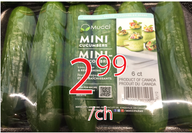
Concombre libanais (paquet de 6) Canada