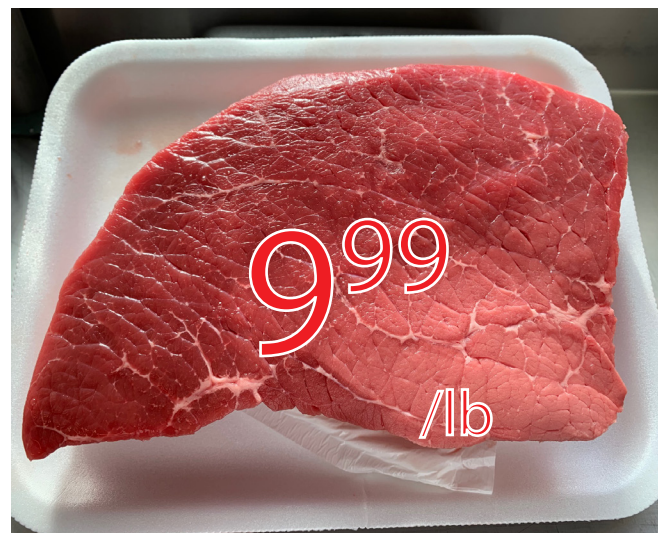
Roti de croupe 22.02$/kg