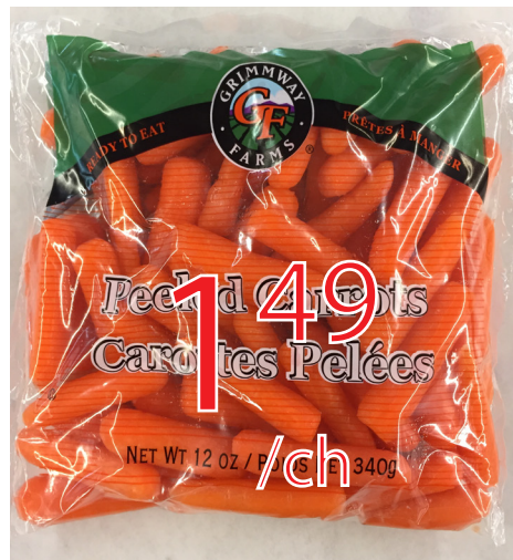
Mini carotte pelée 240g États-Unis