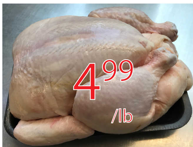
Poulet entier frais 11$/kg