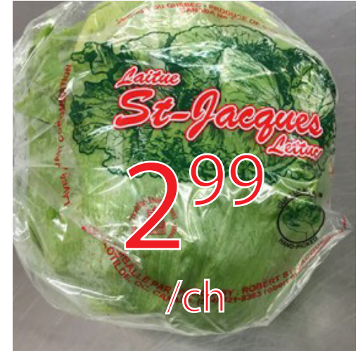
Laitue pommée Gr.24 Californie