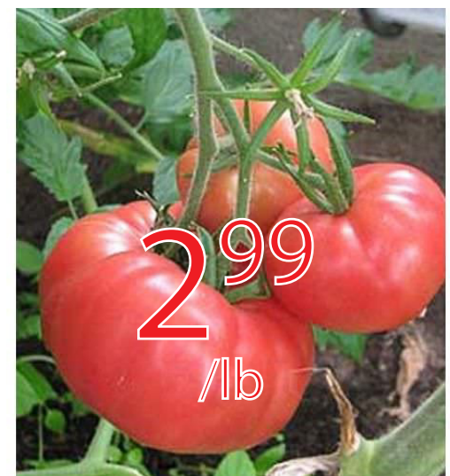
Tomate rose Québec 6.59$/kg