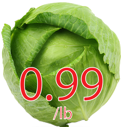
Chou vert Québec 2.18$/kg