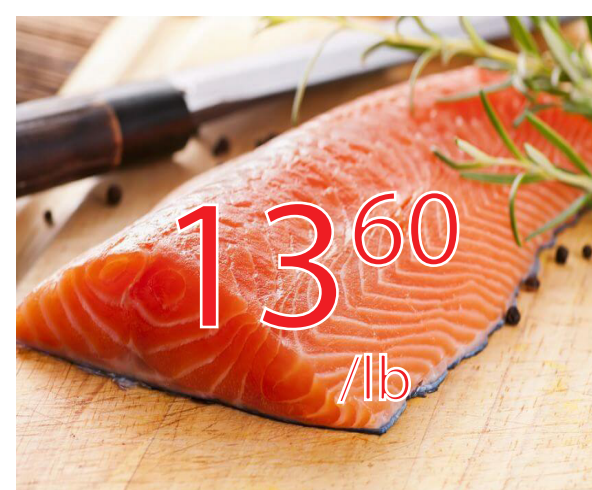
Filet saumon familial 29.99$/kg