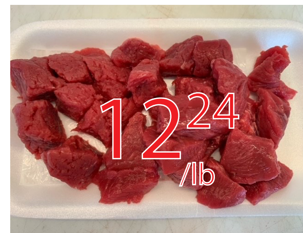
Boeuf fondue bourguignonne Attendri mecaniquement 26.99$/kg