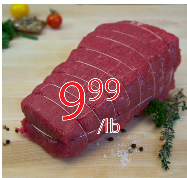
Rosbif français Attendri mecaniquement 22.02$/kg