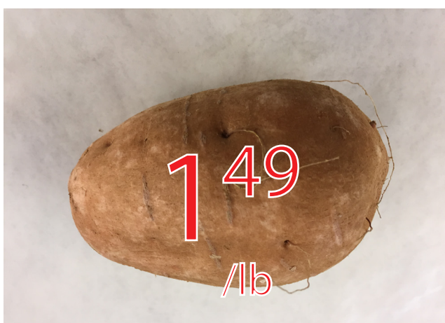
Patate douce États-Unis 3.28$/kg