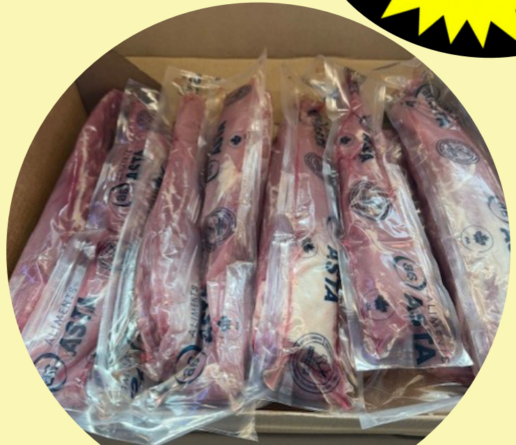
Filet mignon de porc 10 lb