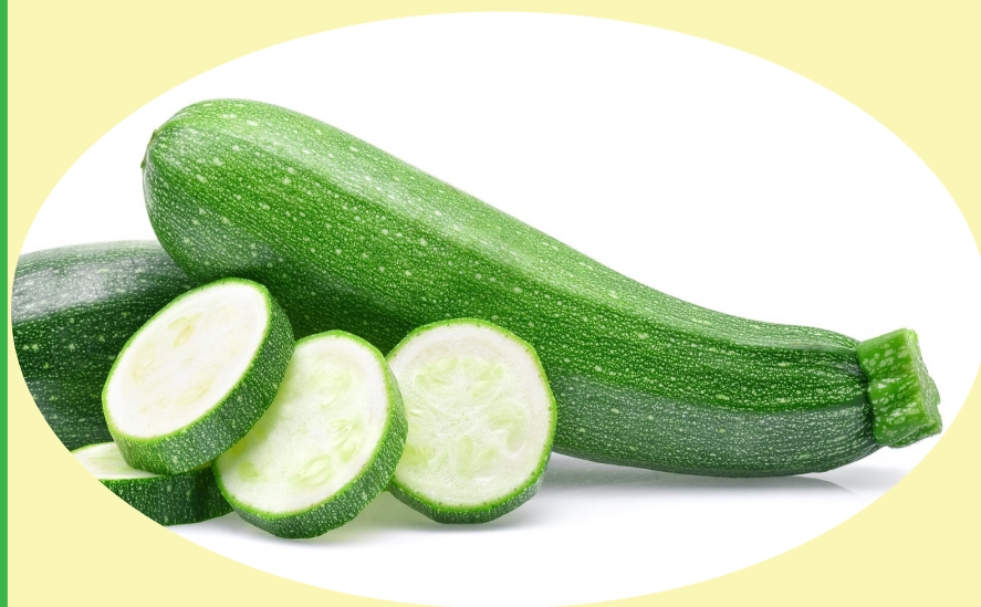
Zuchinni Mexique 5.49$/kg