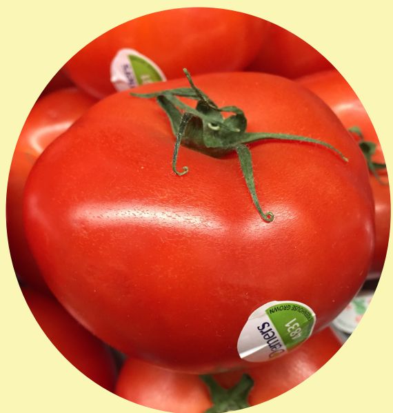
Tomate rouge préemballées Serre Demers 6.59$/kg