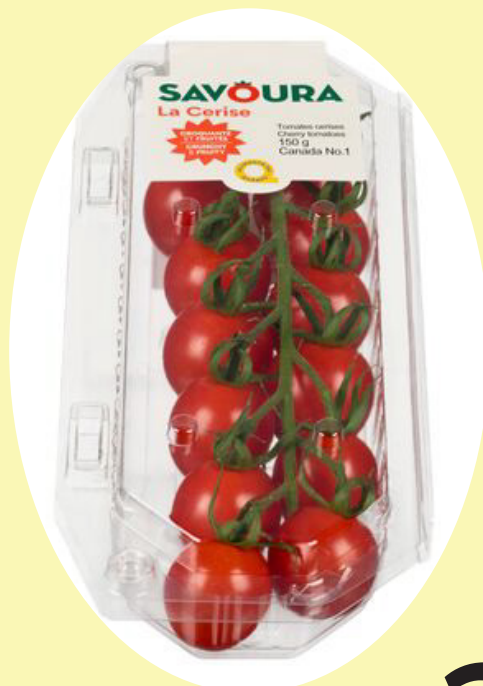
Tomate cerizo 150g Quebec