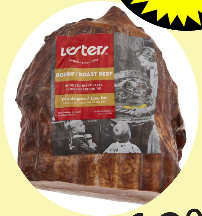
Roast beef cuit Lesters 44.07$/kg