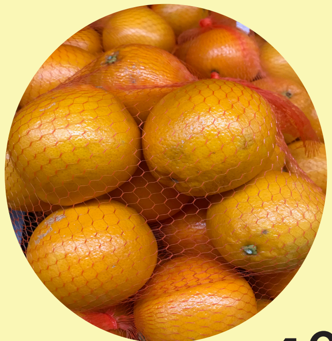
Orange filet de 6 Maroc