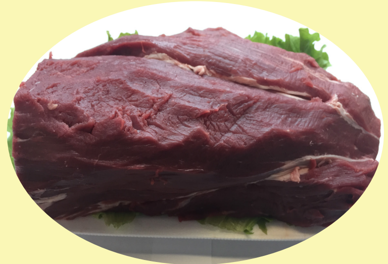
Filet mignon complet 59.99$/kg