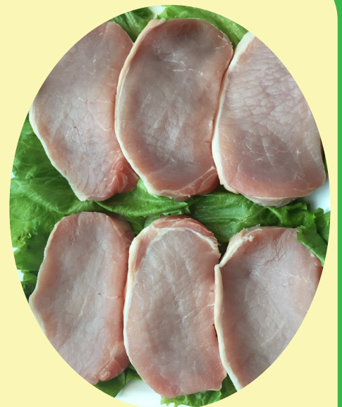
Filet mignon de porc ou cotelette de porc familial 17.61$/kg