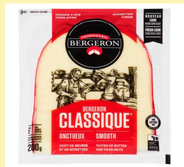
Bergeron pointe de 200g Choix : Louise Cyr, classic, patte Blanche, Six pourcent, fin Renard ou fumé