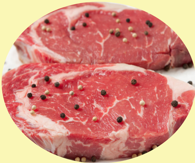
Faux filet angus AAA 63.99$/kg