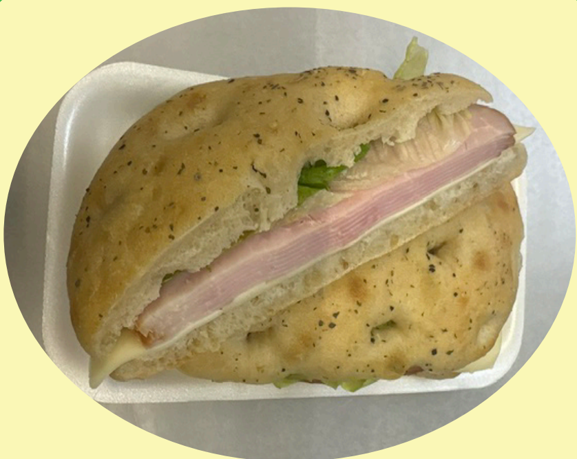
Pain sciacciata aux herbes de provence 200g