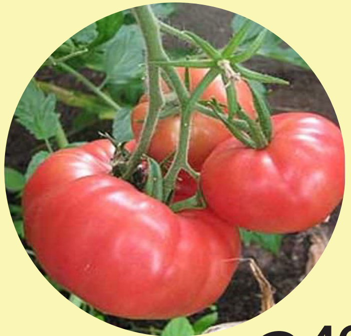
Tomate rose Québec 5.49$/kg