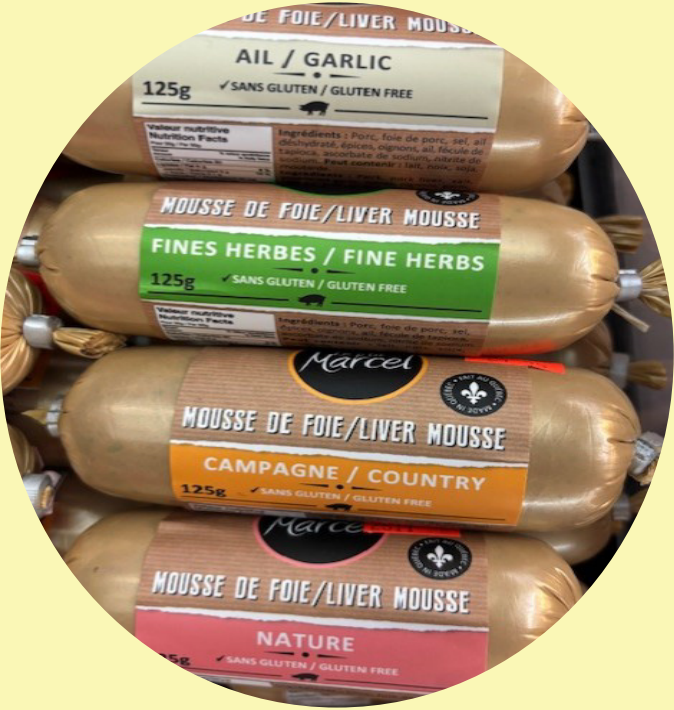
Mousse de foie au choix Le p'tit Marcel 125g