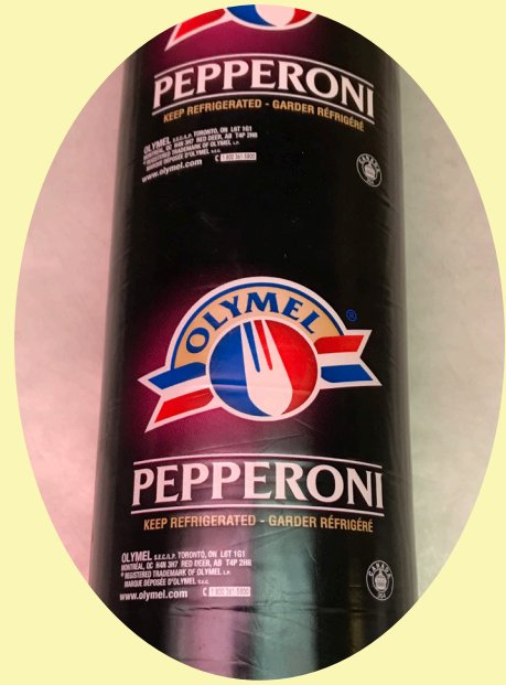
Pepperoni Olymel 15.41$/kg