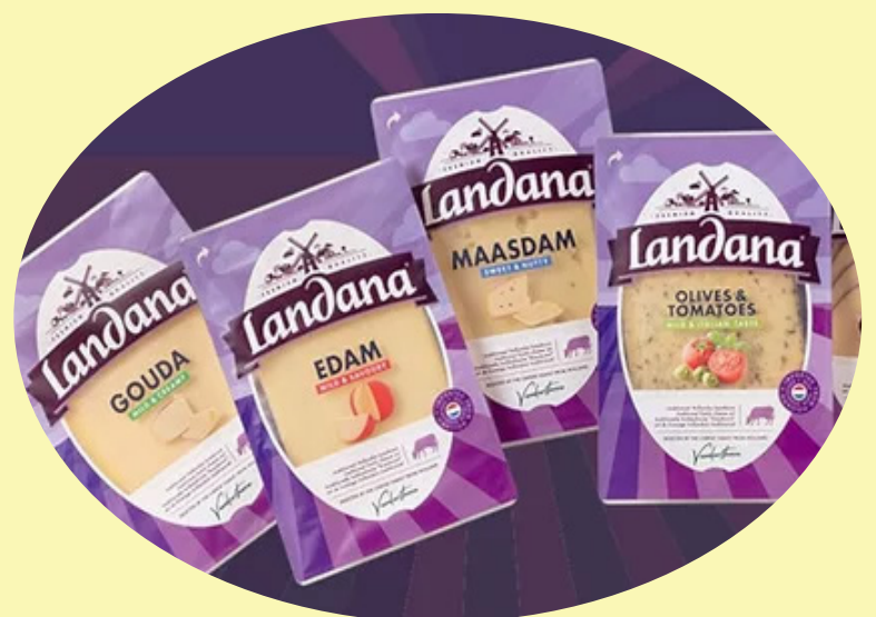
Landana Fromage en tranche Choix : maasdam, edam, gouda ou olives et tomates