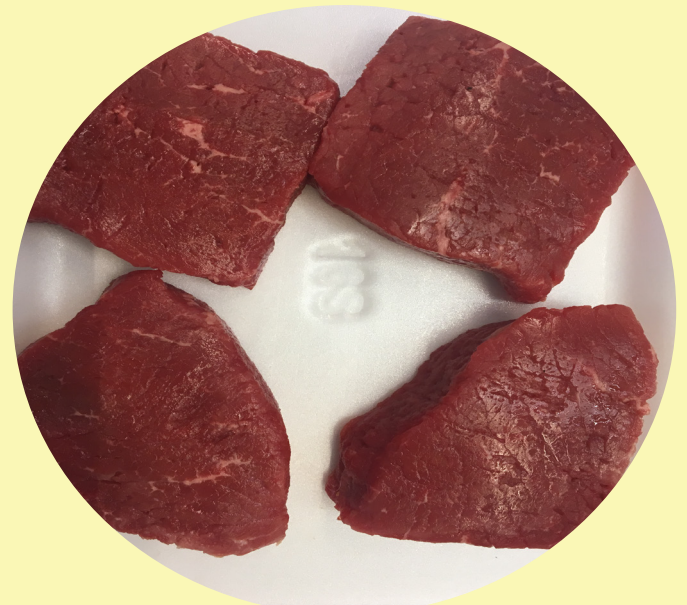
Tournedos boeuf familial 29.99$/kg