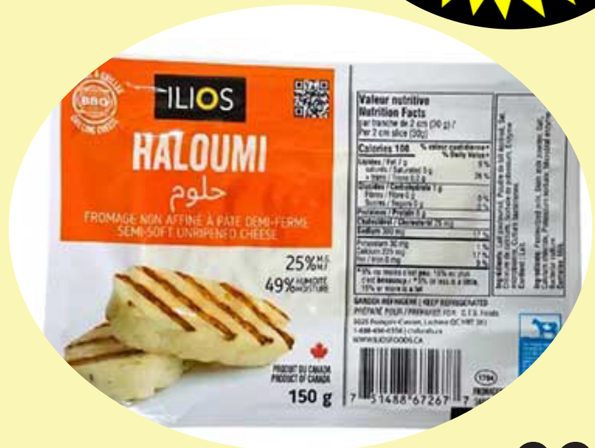
Haloumi Ilios Fromage a griller 150g