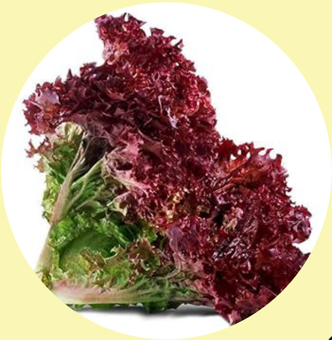
Laitue frisée rouge Québec