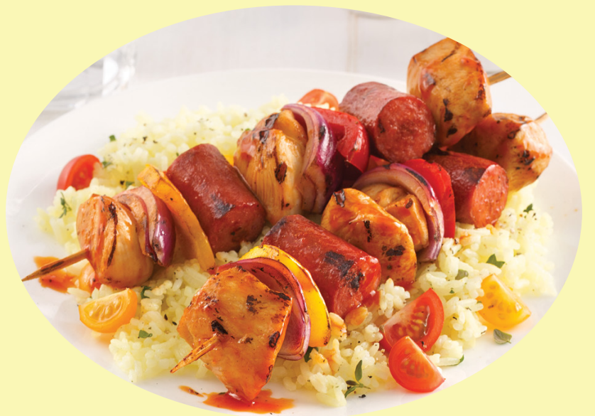
Brochette de poulet Maison corne 26.43$/kg