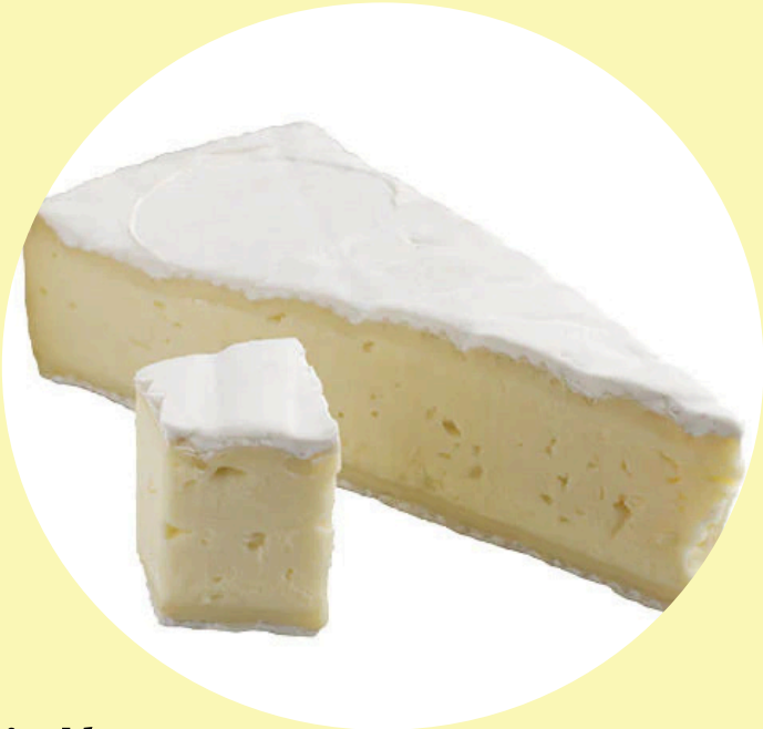
Brie L'extra double crème Agropur 37.46$/kg