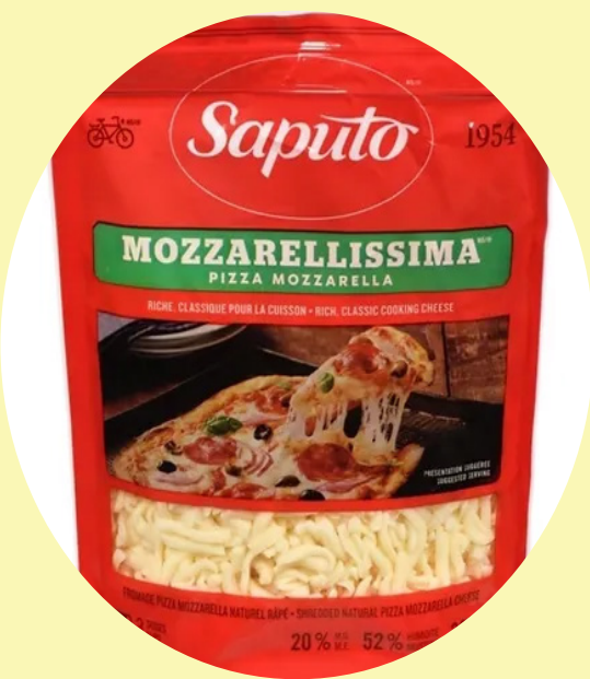
Mozzarellissima rapé Saputo 320g