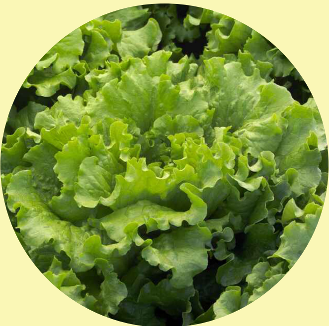
Laitue frisée verte Québec